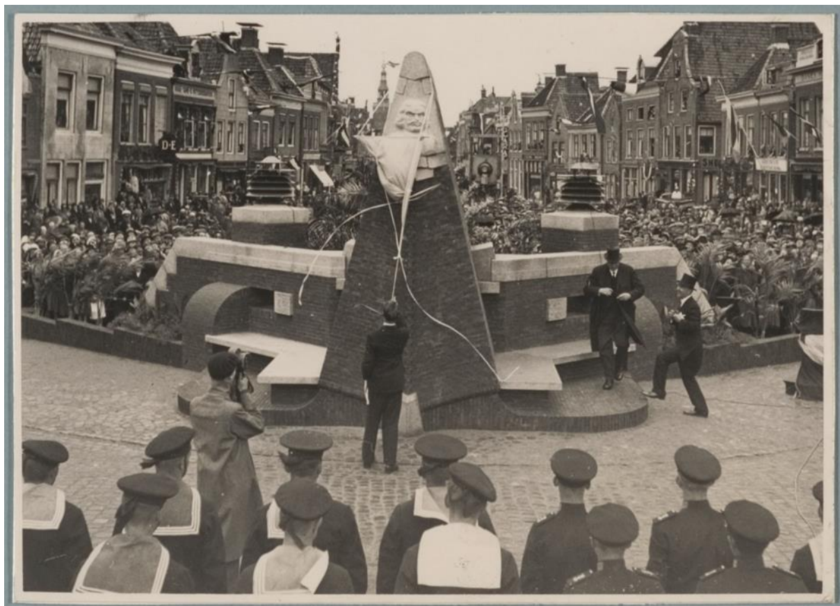
Onthulling van het Tjerk Hiddes-Monument op de Grote Bredeplaats in 1934.