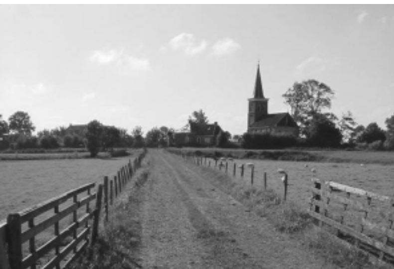
Gezicht op Leons

De activiteiten van de Stifting ArgHis hebben in het afgelopen jaar op een iets lager pitje gestaan dan we zelf wel gewild zouden hebben. Dat betekent natuurlijk niet dat er niets gebeurd is. Het is nu eenmaal zo dat een aantal zaken, waarmee we ons wel degelijk hebben bezig gehouden, zich wat meer op de achtergrond afspeelen. We hebben het dan b.v. over het verstrekken van adviezen op