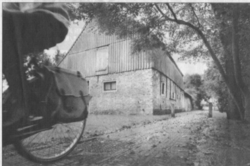
Het oudste pand van Easterein: het komelkershúske en de bijbehorende schuur.

De rentmeesters van de hervormde kerk kochten het komelkershúske toen de hervormde pastorie en de bijbehorende tuin voor € 150.000 waren verkocht aan de Amsterdamse familie Landstra. Het was de bedoeling dat het oude húske het veld zou ruimen voor een nieuw ver-