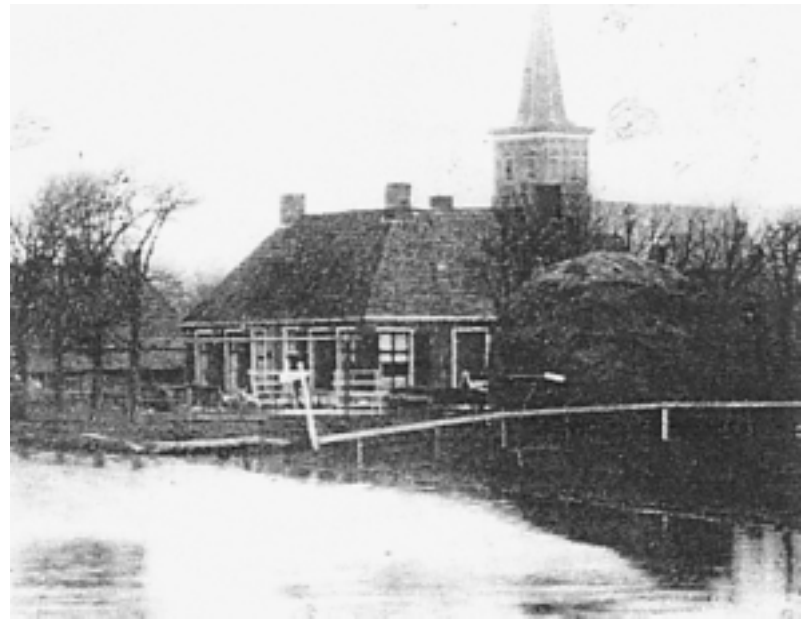
Detailfoto fan ZO IS 'T letter HUIS STRUIK / FILADELPHIA, ca. 1895 (út: Bokma en Kuipers 1985:13)