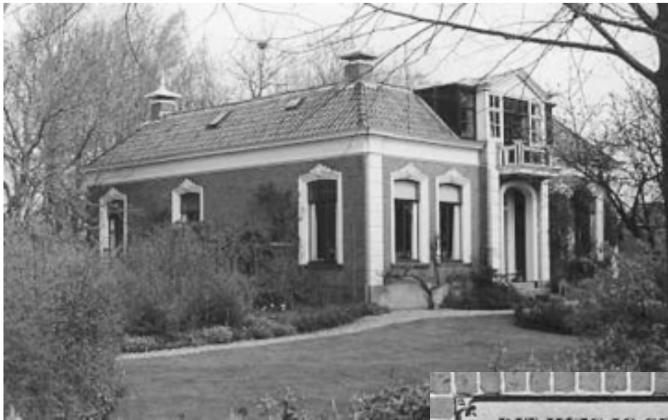
Seerp v. Galemawei 8 - Mantgum