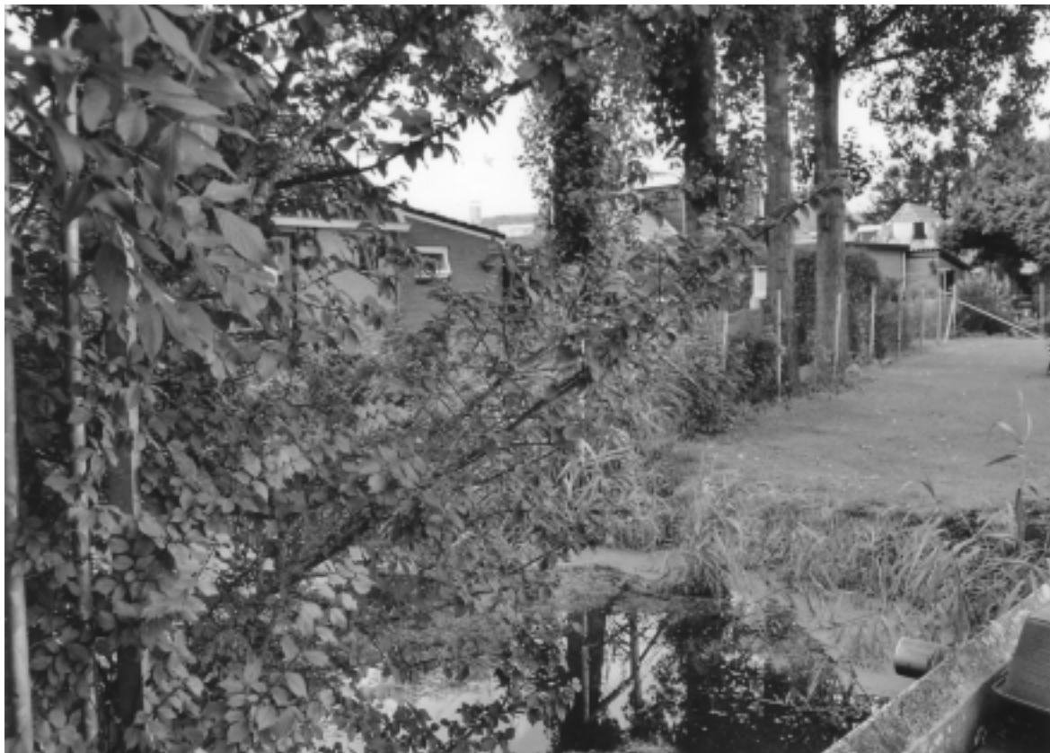
In âld stikje lykfeart tusken it keatsfjild en it Stroek te Wommels

En as oanfolling op dit stikje: Lammert Lammerts Camp keapet yn 1681 de ‘schuitemakerij’ oan’e Trekfeart, mei dan as neistlizzers súdlik en eastlik fan de helling ‘de arme landen der kercke’. De helling wurdt yn dat jier brûkt troch mr. schuitemaker Claes [Nannes?] en ferkocht troch