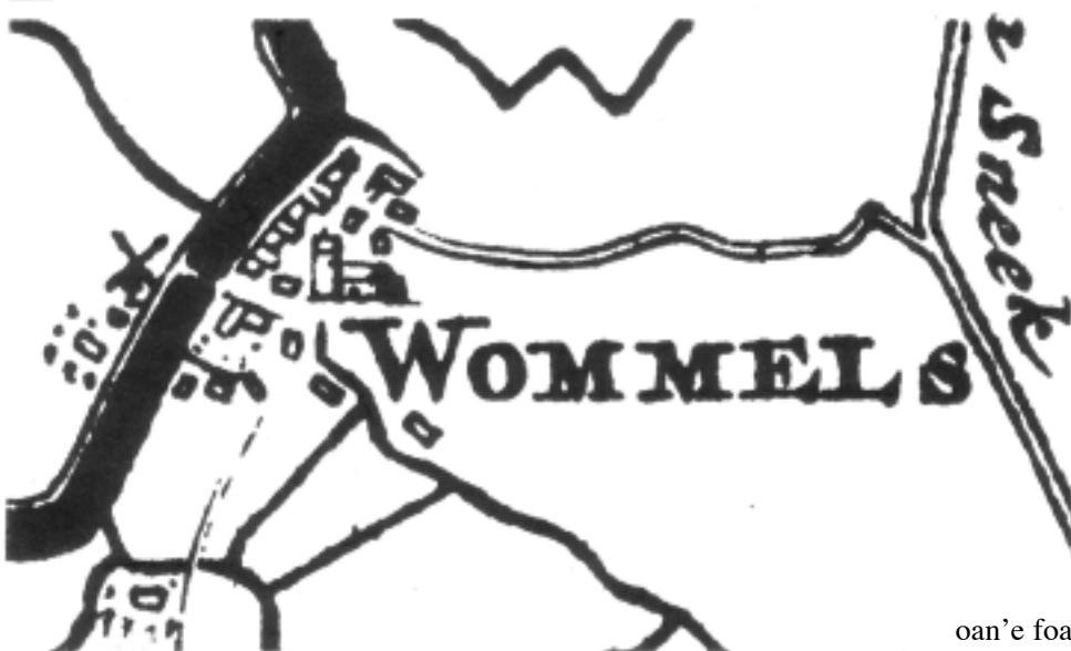
In stikje fan de kaart fan Schotanus-Halma út 1718 [tige útfargerutte]

Dúdlik rint op dit kaartsje út 1718 in feart benoarden en -noardwesten it Stroek fierder troch nei it noarden (lofts fan de W fan Wommels), nei wer't no sawat it gemeenthûs stiet, en dat makket dizze lykfeart 'fan Stroek' no krekt sa bysûnder: