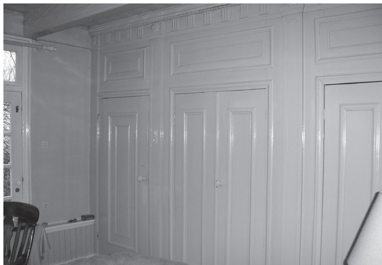
Wandbetimmering in de herenkamer (dat is de opkamer).