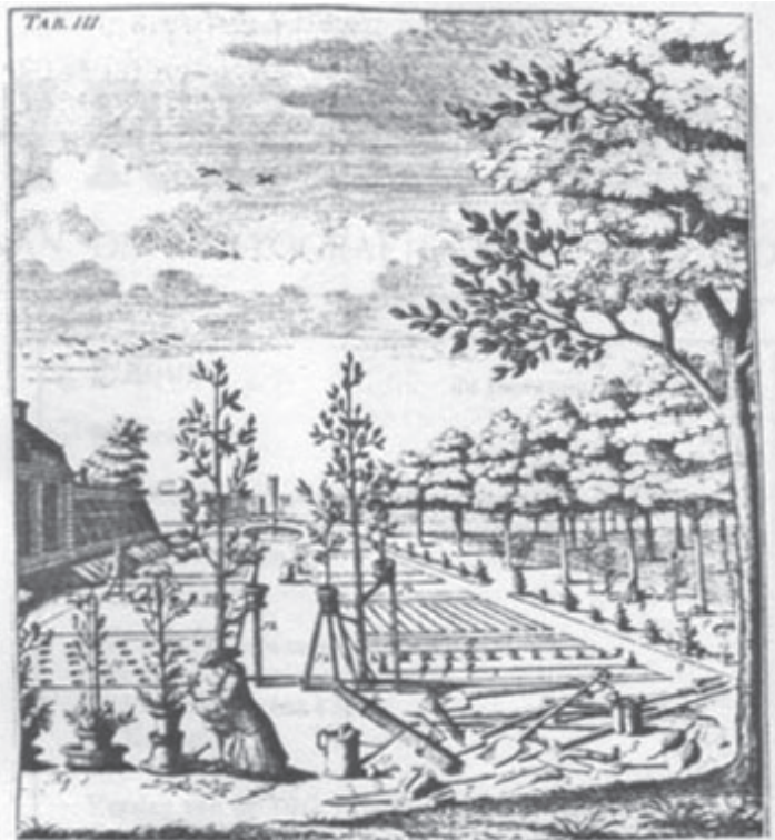
Een plaat uit "De Beschouwende en werkdadige Hoveniers Konst" (1753).