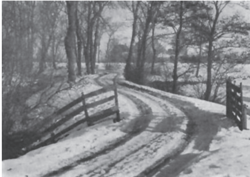
Op weg naar Tsjerkebuorren, zicht op Gerbada (ca. 1957)

Er zijn van die erven die een onweersaanbare aantrekkingskracht op de beschouwer kunnen hebben. Zo'n erf is dat van de boerderij op Tsjerkebuorren 5 in Easterwierrum (vanouds, dat is te zeggen vanaf 1640, stem 1). Het is groot, heeft een oude oprijlaan en er staat een monumentale boerderij op. Er is iets van vroegere grootheid bewaard. Ook minder imposante erven kunnen dat trouwens hebben, het gaat er maar om of de tijd even stil lijkt te hebben gestaan. 1