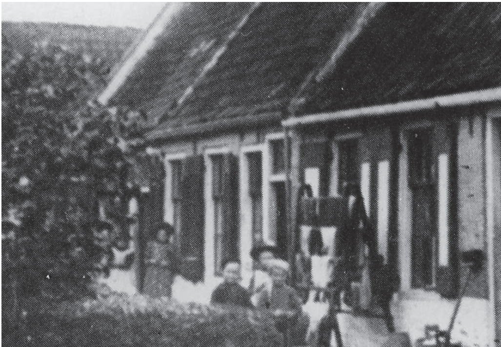
De westside fan it Hiem, sjoen fanôf de Terpside fan de 'gemene Straat'. Yn it midden de twa huzen fan dizze bijdrage (de foto, fan ca. 1900, is in útsnijing út: Bokma en Kuipers 1985)